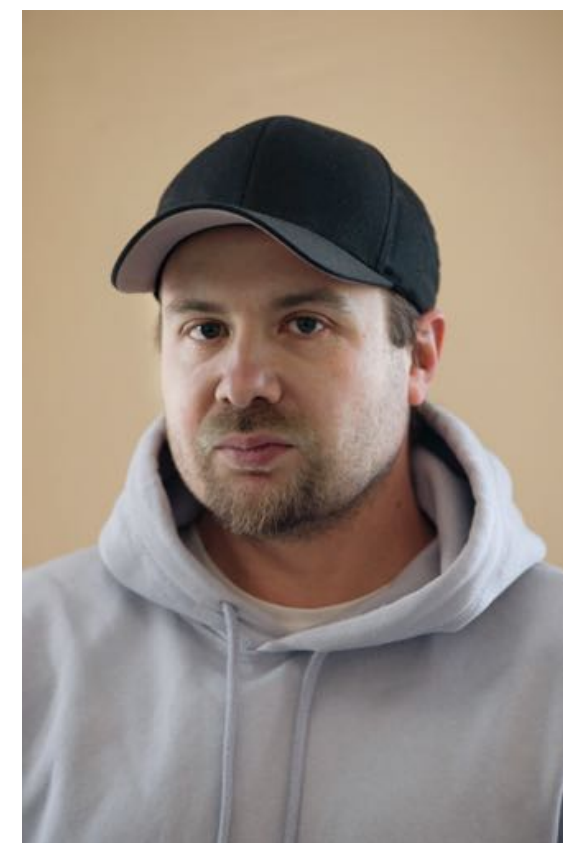
Vincent Wikström Musik/Sound