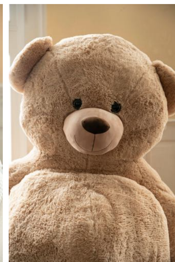
Teddy Performance/ Projektionsfläche